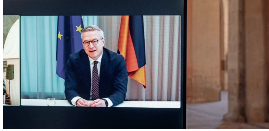
Ministerkeynote Dr. Karsten Wildberger

Ich gehe noch einen Schritt weiter. Ich bin überzeugt: Wir brauchen eine extrem ambitionierte politische Agenda für KI und