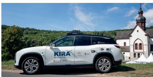
Das autonome Fahrzeug KIRA live auf der Konferenz

Offiziell bekennt sich Safe Driver „ausdrücklich zur Dienstleistung Taxi“. Die strategisch interessantere Lesart liegt aber eine Ebene tiefer. Uber sichert sich hier die